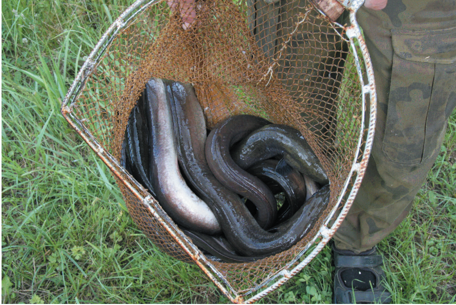
Fot. 1. Węgorze srebrzyste z rzeki Węgorapa