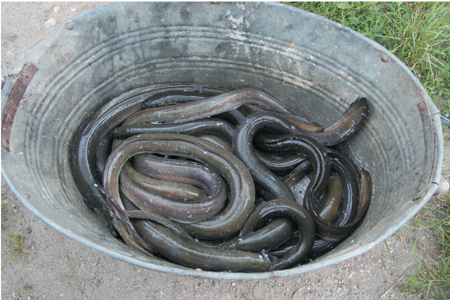
Fot. 2. Węgorze żółte złowione sprzętem pułapkowym